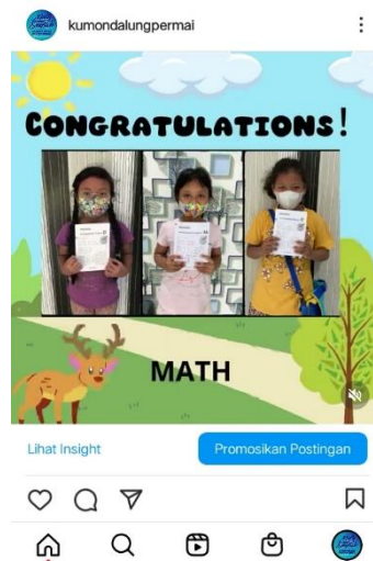
Gambar 1. Tampilan Konten yang Telah Diunggah Pada Media Sosial Instagram