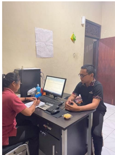
Gambar 4. Perhitungan dan Pemberian Gaji dengan Menggunakan Program Microsoft Excel