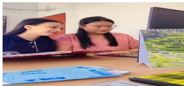
Gambar 1. Pelatihan penggunaan Microsoft Excel beserta rumus yang digunakan kepada pegawai