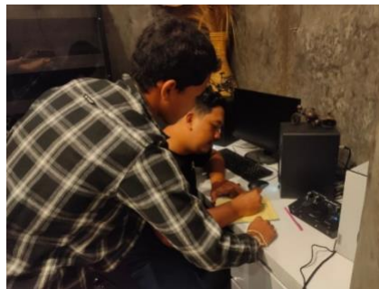
Gambar 1. Sosialisasi pencatatan stok persediaan dengan kartu stok

Program kerja pertama yang dilakukan adalah sosialisasi pencatatan stok persediaan menggunakan kartu stok. Dalam laporan keuangan, persediaan merupakan hal yang sangat penting karena baik laporan laba rugi maupun neraca tidak akan dapat disusun tanpa mengetahui nilai persediaan (Paraswati, 2021). Program kerja ini dilakukan dengan memberi sosialisasi dan pelatihan mencatat stok persediaan melalui kartu stok. Setelah dilakukannya program kerja ini mitra mampu mencatat stok persediaan menggunakan kartu stok.