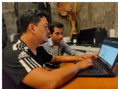
Gambar 3. Pelatihan pembukuan sederhana transaksi tunai dan non tunai