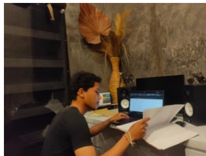
Gambar 5. Pemeriksaan omzet harian

Program kerja ketiga adalah melakukan pemeriksaan omzet harian baik secara fisik pada jurnal omzet dan secara digital pada sistem komputer. Program kerja ini dilakukan dengan membantu bagian administrasi (keuangan) untuk melakukan pemeriksaan omzet harian agar lebih efektif dan tidak melibatkan sales dalam proses pemeriksaannya. Setelah dilaksanakannya program ini, mitra terbantu dalam proses pemeriksaan omzet hariannya dan diharapkan kedepannya dapat berlangsung dengan lebih efektif.