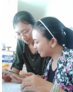
Gambar 2. Pengenalan dan pelatihan cara menggunakan aplikasi

pencatatan serta data yang diberikan akurat, konsisten dan cepat sehingga dapat mengefisien waktu dan tenaga.