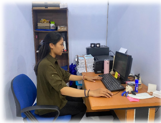
Gambar 1. Melakukan pelatihan sistem kearsipan sederhana dengan Hardisk dan Google Drive.