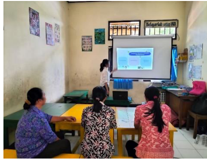
Gambar 1. 2 Membantu mengembangkan system pencatatan transaksi keuangan ke system digital