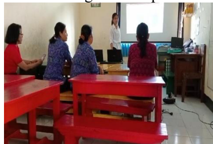
Gambar 1. 4 Mengembangkan media promosi menggunakan media sosial seperti facebook dan Instagram