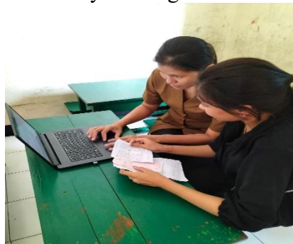
Gambar 1. 3 Memberikan sosialisasi pemahaman mengenai pentingnya media sosial sebagai media promosi