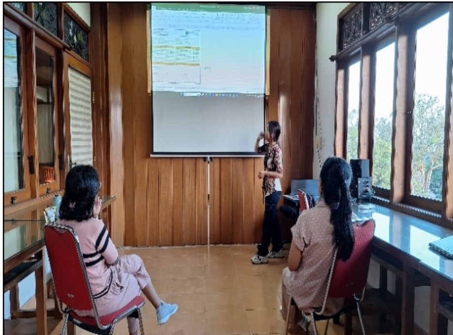
Gambar 5. Sosialisasi Pembuatan Form Slip Gaji

Realisasi capaian program kerja dapat dilihat dari tabel berikut: