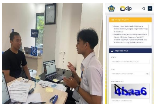
Gambar 2. Mendampingi dan mengarahkan wajib pajak terkait registrasi akun DJP online