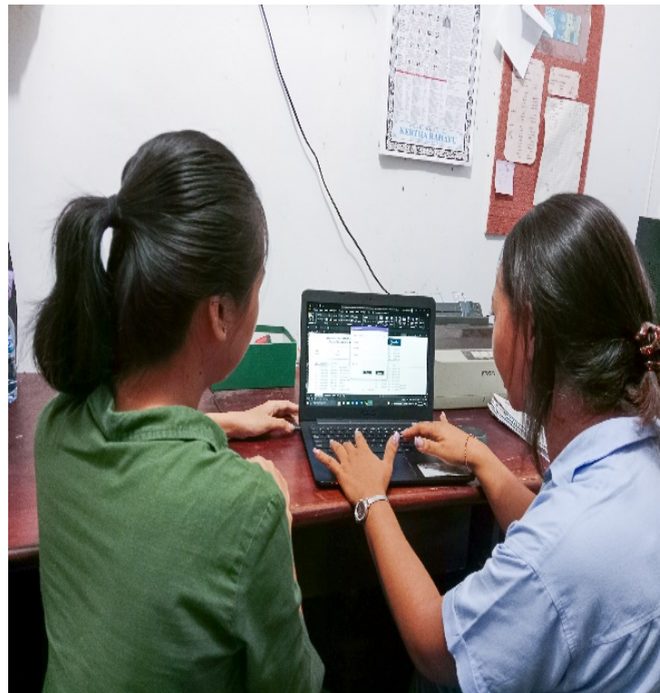
Gambar 3: Pelatihan dan pendampingan kepada mitra dalam pengaplikasian template buku kas harian