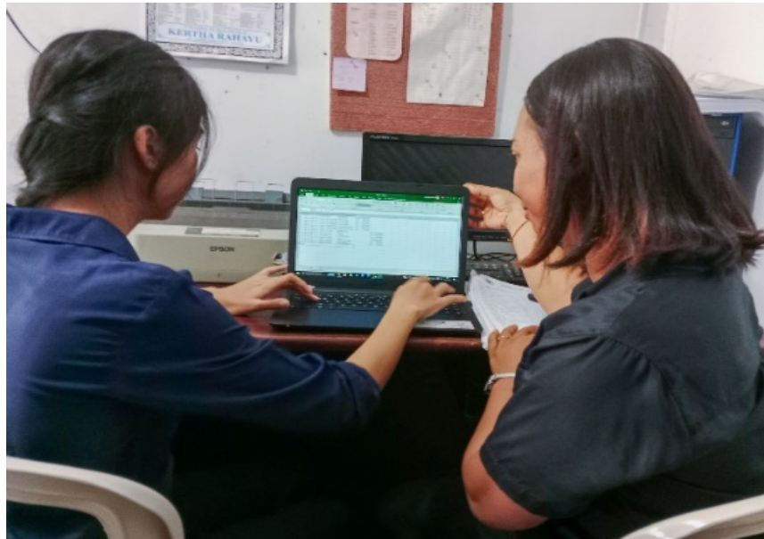
Gambar 1: Pelatihan penggunaan rumus Excel sederhana kepada karyawan

Pencapaian program kerja kedua yaitu pembuatan template buku kas harian sederhana menggunakan Excel untuk mitra. Dengan adanya pembuatan template buku kas harian ini dapat membantu mitra dalam meningkatkan pencatatan buku kas harian mereka menjadi lebih modern di era digitalisasi ini. Hal ini juga memberikan dampak positif kepada mitra karena dapat membuat pencatatan buku kas harian mereka menjadi lebih efektif dan efisien serta dapat meminimalisir kesalahan dalam pencatatan.