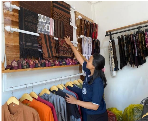
Gambar 1. Melaksanakan Kegiatan Observasi di Sabda Jaya Collection

mudah untuk berdiskusi tentang apapun yang menjadi permasalahan selama melakukan program kerja tersebut.