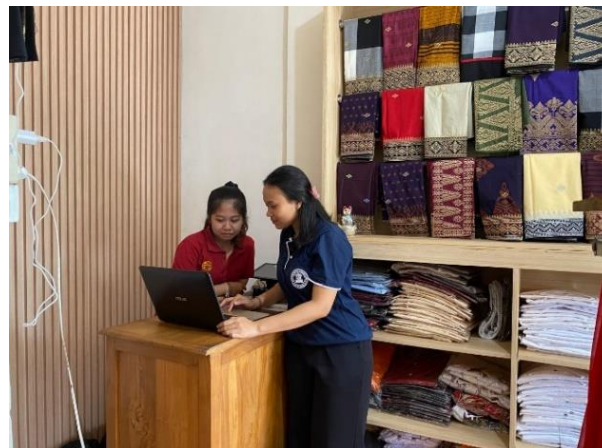
Gambar 2. Pelatihan Pembukuan Digital di Excel