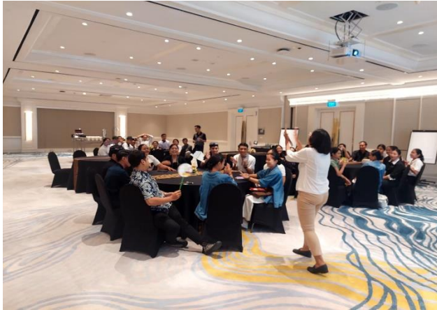
Gambar 2. Pelatihan dan Pengembangan