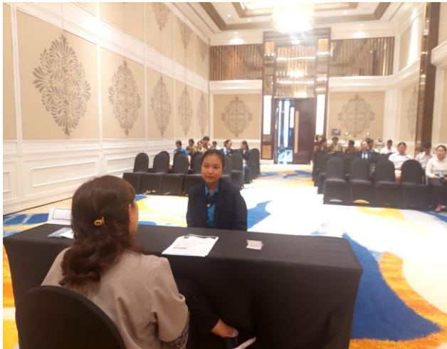
Gambar 1. Proses Interview Kandidat