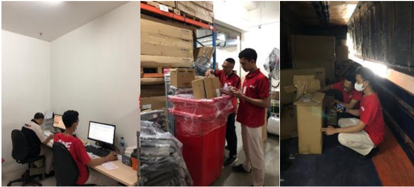
Gambar 1. Menginput laporan data barang, memonitoring barang masuk dan keluar