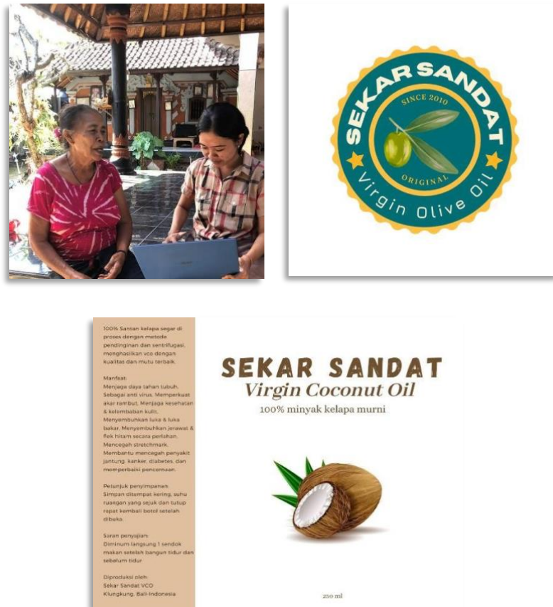
Gambar 4. Mendesain logo usaha sekaligus stiker kemasan