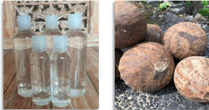
Gambar 1. Kondisi Produk pada UMKM Mitra

maksimal bagi kesehatan, terutama berfungsi untuk membantu proses penyembuhan dan mengatasi berbagai penyakit.