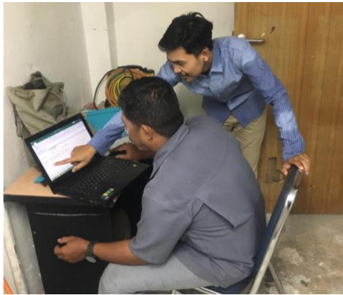
Gambar 6. Pelaksanaan program kerja ketiga yaitu pembuatan pembukuan sederhana

Kegiatan pelaksanaan program kerja kedua yaitu pemasaran produk melalui e-catalogue dilaksanakan untuk membantu perusahaan dalam memperluas jangkauan konsumen dan melaksanakan instruksi dari pemerintah. Kegiatan ini memberikan hasil yang sangat baik karena, dengan memasarkan produk melalui e-catalogue diharapkan dapat memberikan efisiensi bagi penyedia jasa.