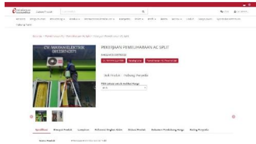
Gambar 3. Katalog produk yang telah dibuat

Kegiatan pelaksanaan program kerja pertama yaitu pelatihan pembuatan katalog produk menggunakan aplikasi Canva mendapatkan hasil bahwa perusahaan sudah memiliki pemahaman yang cukup mengenai cara pembuatan katalog produk dengan aplikasi Canva sehingga dengan adanya katalog yang menarik dapat menarik minat konsumen. Kegiatan ini dapat berjalan dengan baik berkat semangat perusahaan yang tinggi untuk bisa membuat katalog produk yang menarik.