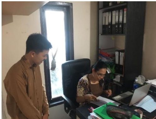
Gambar 1. Kegiatan observasi dengan Direktur CV. Wayan Elektrik

Berdasarkan tabel rekapitulasi kuisisioner tersebut maka tanggapan responden terhadap pertanyaan kuesioner pertama terjadi peningkatan sebesar 30%, pertanyaan kedua terjadi peningkatan sebesar 90%, pertanyaan ketiga terjadi peningkatan sebesar 70%, pertanyaan keempat terjadi peningkatan sebesar 30%, pertanyaan kelima terjadi peningkatan sebesar 90%, pertanyaan keenam terjadi peningkatan sebesar 90%, pertanyaan ketujuh terjadi peningkatan sebesar 80%, pertanyaan kedelapan terjadi peningkatan sebesar 90%, dan pertanyaan kesembilan terjadi peningkatan sebesar 80%. Secara umum terjadi peningkatan pengetahuan sasaran rata-rata sebesar 69%. Hal ini menunjukkan keberhasilan program kerja yang telah dilaksanakan di CV. Wayan Elektrik.