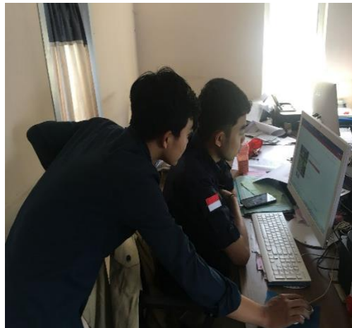
Gambar 4. Pelaksanaan program kerja kedua yaitu pemasaran produk melalui e-commerce

Kegiatan pelaksanaan program kerja pertama yaitu pelatihan pembuatan katalog produk menggunakan aplikasi Canva mendapatkan hasil bahwa perusahaan sudah memiliki pemahaman yang cukup mengenai cara pembuatan katalog produk dengan aplikasi Canva sehingga dengan adanya katalog yang menarik dapat menarik minat konsumen. Kegiatan ini dapat berjalan dengan baik berkat semangat perusahaan yang tinggi untuk bisa membuat katalog produk yang menarik.