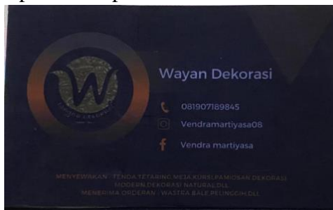
Gambar 3. Kartu Nama