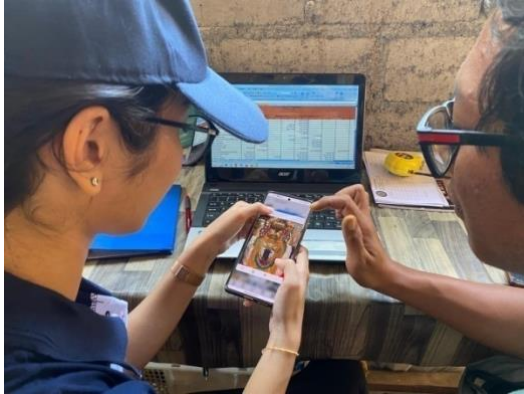
Gambar 2. Pengenalan Sosial Media