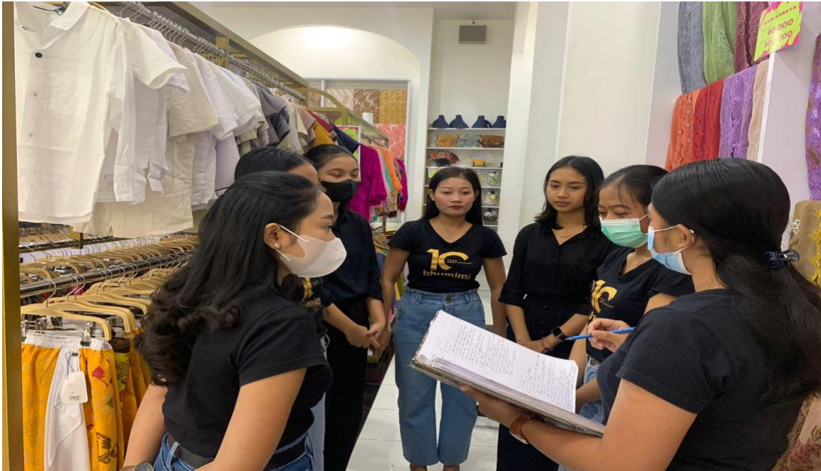
Gambar 3. Briefing sebelum melakukan penelusuran stok