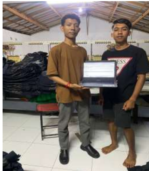
Gambar 2. Kegiatan Sosialisasi Mengenai Cara Pemakaian System Laporan Keuangan Berbasis Excel