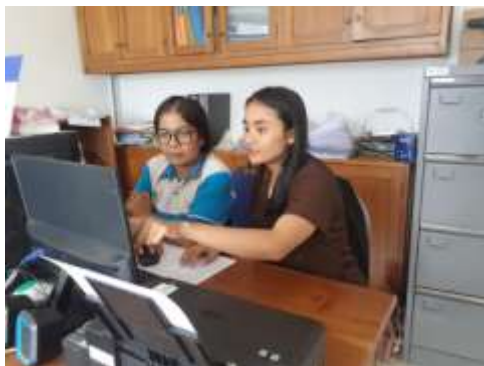
Gambar 4. Kegiatan Pendampingan