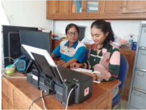
Gambar 2. Kegiatan Penyuluhan