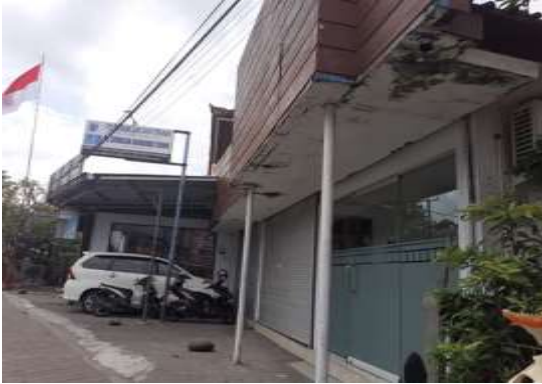
Gambar 1. PT. Sembilan Jaya Teknik

No. 36 Kelurahan Kerobokan, Kecamatan Kuta Utara Kabupaten Badung ini merupakan salah satu perusahaan rekanan Perusahaan Listrik Negara (PLN). Saat ini, PT. Sembilan Jaya Teknik memiliki karyawan sebanyak 45 orang. Dalam melaksanakan kegiatan operasionalnya, PT. Sembilan Jaya Teknik akan mengerjakan kontrak yang diberikan oleh PLN, khususnya di bidang jaringan tegangan menengah. Kontrak tersebut meliputi pemasangan baru KWH, tambah daya, ataupun perluasan jaringan tegangan menengah (JTR).