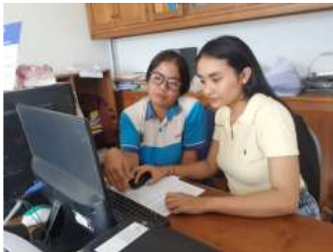
Gambar 3. Kegiatan Pelatihan