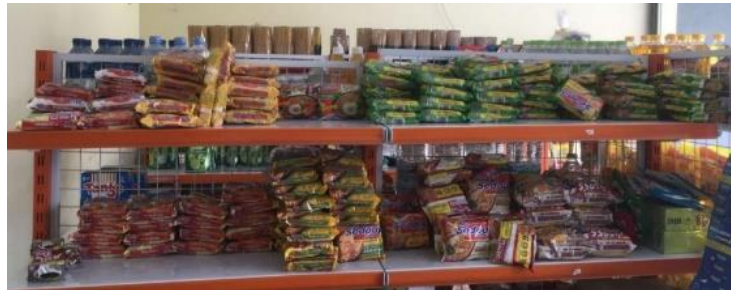
Gambar 3. Pembuatan foto produk

Pembuatan foto produk yang akan dipromosikan dilakukan selama 3 hari, yaitu pada 16 Maret sampai dengan 18 Maret 2023. Kegiatan dimulai dengan melakukan foto satu persatu produk yang ada di BUM Desa Cani Sejahtera Bersama yang kemudian di unggah di akun instagram dan facebook sebagai media promosi.