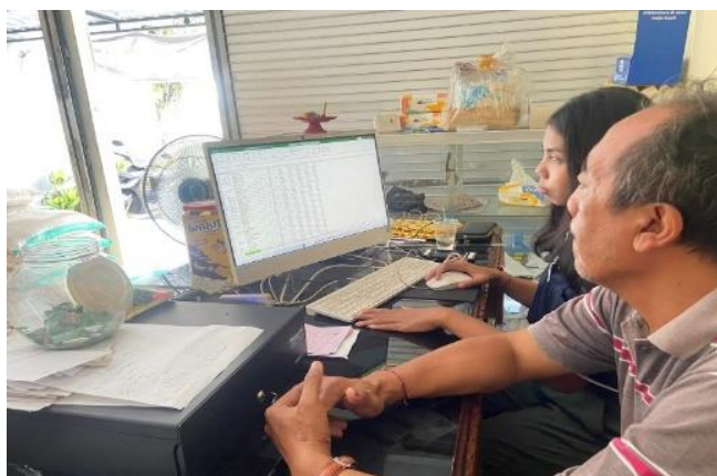
Gambar 4. Pengenalan dan pelatihan cara menggunakan sistem excel

Pengenalan dan pelatihan cara mengoperasikan pembuatan laporan keuangan menggunakan aplikasi excel dilakukan selama 12 hari, yaitu pada 20 Maret sampai dengan 31 Maret 2023. Kegiatan dimulai dari melakukan pengenalan bagaimana cara menggunakan aplikasi excel, setelah memahami fitur-fitur yang ada di aplikasi excel serta fungsi dari masing-masing fitur tersebut diadakan pelatihan bagaimana mengoperasikan sistem excel yang akan digunakan untuk membuat laporan keuangan. Tujuan pembuatan laporan keuangan berbasis excel dilakukan untuk meminimalisir kesalahan yang bisa terjadi pada laporan keuangan di BUM Desa Cani Sejahtera Bersama yang sebelumnya dibuat secara manual.