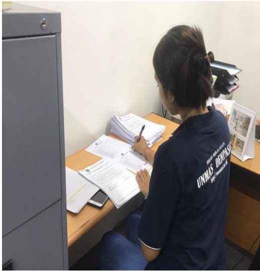
Gambar 1. Melakukan pendataan Employment Contract yang sesuai dengan file.