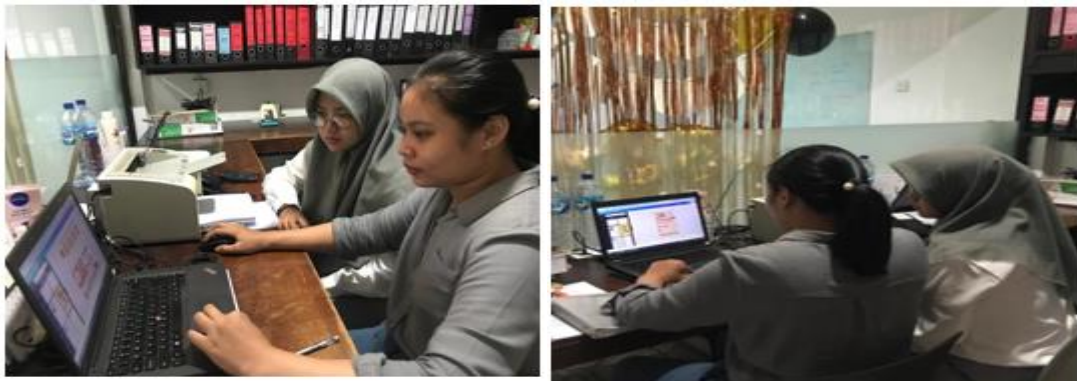
Gambar 1. Pembuatan media sosial dan konten media sosial