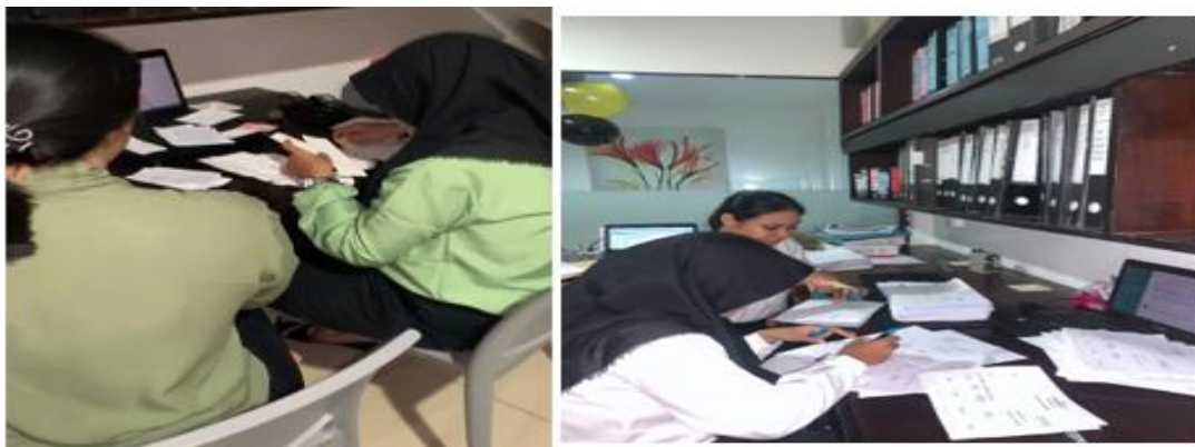
Gambar 3. Merapikan dokumen transaksi

Adapun faktor pendukung dalam keberhasilan kegiatan ini adalah: