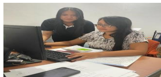
Gambar 4. Implementasi membuat daftar permintaan barang konsumen