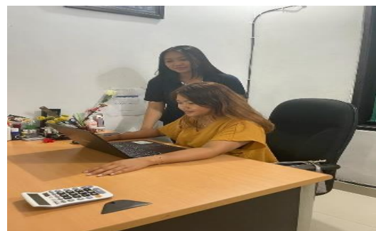
Gambar 2. Implementasi membuat buku besar pembantu piutang.