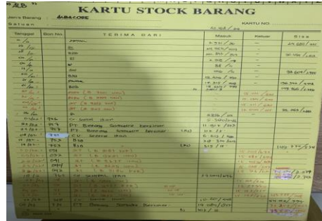
Gambar 3. Pencatatan perhitungan fisik persediaan dalam bentuk manual.