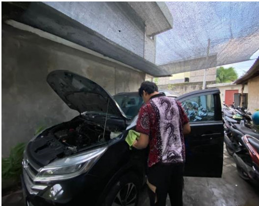
Gambar 1. Servis Rutin Sebelum Jadwal Keberangkatan

Partisipasi driver lokal dan forum driver canggu dalam analisis penetapan biaya transportasi mobil berdasarkan biaya operasional pada PT.Trinusa Travelindo (traveloka.com), terbukti dari keikutsertaan mereka dalam pelaksanaan kegiatan. driver mulai merasakan ada nya dampak serta perubahan dengan melakukan system ini dan tidak perlu lagi bersusah payah untuk menawarkan penjemputan dan pengantaran secara offline dengan itu pendapatan mereka menjadi konsisten dan tidak ada lagi konflik di masyarakat terkait dengan perbedaan harga transportasi lokal yang secara offline jauh lebih tinggi harga nya.