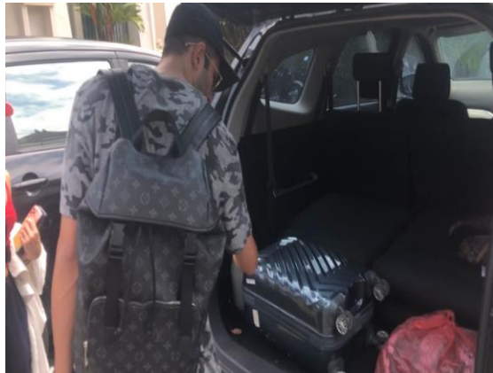
Gambar 2. Penjemputan Menuju Bandara