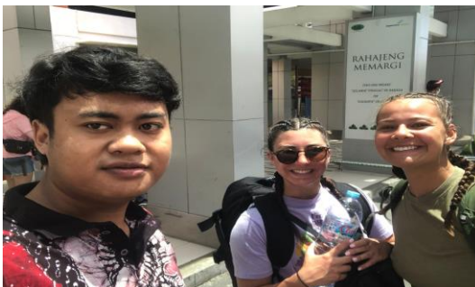
Gambar 3. Penurunan di Drop Point Bandara