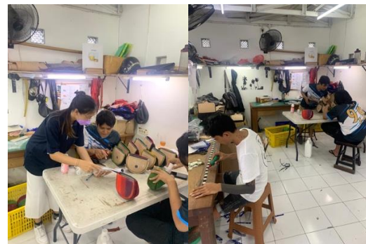
Gambar 4. Pendampingan dan pelaksanaan terkait SOP produksi dan quality control

Setelah melihat dan mengawasi penerapan yang telah dilakukan oleh mitra, tim pelaksana melakukan evaluasi. Evaluasi dilakukan mulai tanggal 5 September 2022 s/d 10 September 2022 yaitu setelah kegiatan pengabdian terlaksana. Pamflet himbauan protokol kesehatan telah dipasang dan karyawan mampu menerapkan protokol kesehatan tersebut, Standar Operasional Prosedur (SOP) produksi dan quality control telah selesai di buat dan karyawan sudah mampu menerapkan SOP tersebut. Tujuannya untuk mengetahui sejauh mana ketercapaian kegiatan pengabdian yang telah dilakukan pada PT. Close2 The Sun.