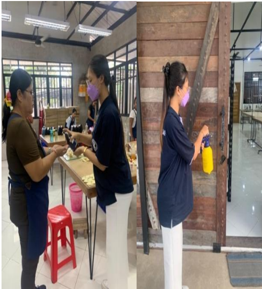
Gambar 1. Pemberian handsanitizer dan penyemprotan disinfektan.

tempat yang disediakan dan penyemprotan disinfektan pada area PT. Close2 The Sun. Dengan pemberian handsanitizer dan penyemprotan disinfektan diharapkan karyawan di PT. Close2 The Sun lebih memahami dan menerapkan protokol kesehatan.