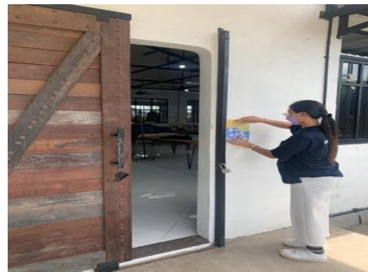
Gambar 2. Pembuatan dan pemasangan pamflet himbauan protokol kesehatan.

Kegiatan selanjutnya adalah pembuatan standar operasional prosedur (SOP) produksi dan quality control. Pembuatan SOP produksi dan quality control dilakukan selama 6 hari, yaitu pada 22 Agustus 2022 s/d 27 Agustus 2022. Kegiatan ini dimulai dengan membuat standar operasional prosedur (sop) produksi dan quality control seperti prosedur pembuatan produk yang benar sesuai katalog dan prosedur penyortiran hingga finishing produk yang benar. Dengan pembuat SOP diharapkan ada pedoman baku bagi karyawan dalam melaksanakan produksi dan quality control di PT. Close2 The Sun.