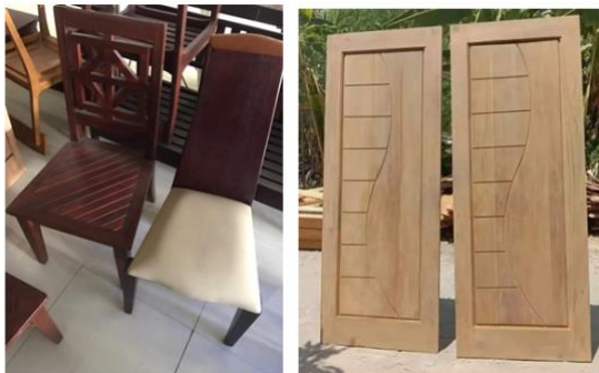
Gambar 3. Hasil pelatihan pembuatan produk baru