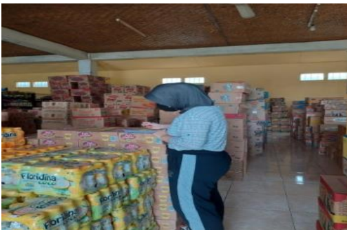
Gambar 2. Proses pengisian dan pengecekan barang menggunakan kartu stok barang.