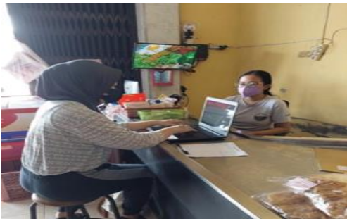
Gambar 1. Proses Pembuatan dan Pengisian Kartu Stok Barang.

Pembuatan kartu stok barang telah dilaksanakan dan dapat digunakan oleh Mitra tersebut dengan baik. Selanjutnya pembuatan media sosial Instagram juga telah dilaksanakan dengan baik dan dapat digunakan untuk mempromosikan barang dagangannya.