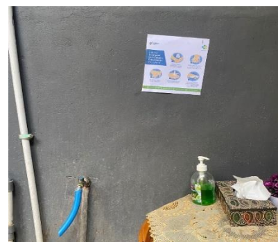
Gambar 2. Pengadaan sabun cuci tangan di usaha mitra

Kemudian tim pelaksana melakukan pengadaan sabun cuci tangan, yaitu pada 12 Agustus 2022. Kegiatan ini dimulai dengan menyediakan sabun cuci tangan. Pemberian sabun cuci tangan ini bertujuan agar karyawan maupun pengunjung UD. Pustaka Nirmala Shanti terhindar dari penularan virus Covid-19