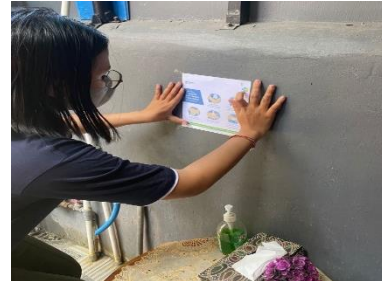
Gambar 1. Melakukan pembuatan dan pemasangan poster cara mencuci tangan yang benar

pengunjung yang datang ke UD. Pustaka Nirmala Shanti memahami cara mencuci tangan sebelum dan sesudah melakukan kegiatan di UD. Pustaka Nirmala Shanti.