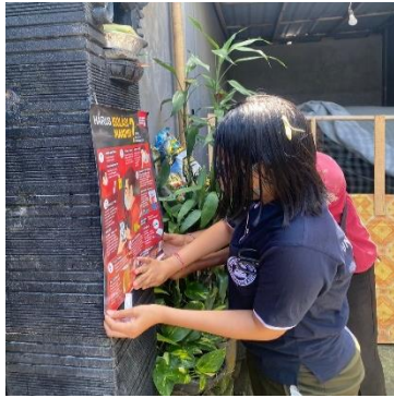
Gambar 3. Pemasangan Pamflet Protokol Kesehatan

Kegiatan ini bertujuan agar karyawan dan pengunjung mengetahui serta menerapkan protokol kesehatan terkini yang diterapkan oleh Pemerintah dan terhindar dari penularan Covid-19.