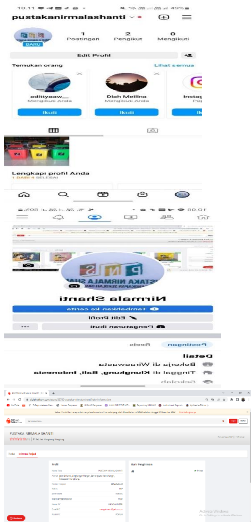
Gambar 6. Pembuatan Akun Media Sosial dan Akun Mitra Siplah

Setelah melalui enam tahapan tersebut tim pelaksana melakukan pendampingan. Pendampingan dilakukan mulai dari tanggal 2 s/d 10 September 2022. Pendampingan dilakukan terhadap karyawan dalam melaksanakan mencuci tangan yang benar, melaksanakan protokol kesehatan, menggunakan Microsoft Excel dalam pembuatan laporan keuangan dan menggunakan media sosial dalam melakukan pemasaran secara online. Tujuannya adalah untuk memantau bagaimana penerapan mencuci tangan, pelaksanaan protokol kesehatan, pembuatan laporan keuangan, dan pengelolaan akun media sosial mitra.