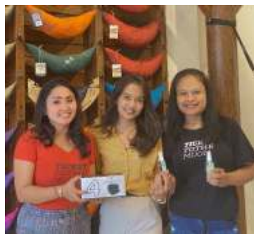
Gambar 3 Menyediakan sarana pendukung protokol kesehatan seperti masker dan hand sanitizer.