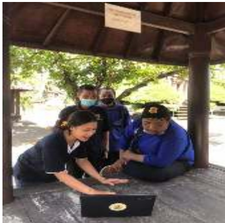
Gambar 2. Edukasi Mengenai Exel

observasi dan wawancara guna mengetahui lingkungan sekitar mitra serta mengetahui permasalahan yang mitra hadapi. Adapun tahapan implementasi dari pelaksanaan program Pengabdian Masyarakat ini diantaranya yaitu :