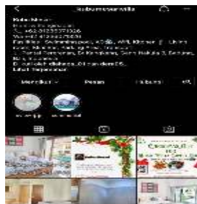
Gambar 4. Akun Sosial Media

Melihat penurunan dari Villa Kubu Mesari di masa pandemi covid-19 saat ini, membutuhkan promosi yang lebih luas. Maka dari itu, tim pelaksana pengabdian masyarakat memberikan pelatihan dan pengertian mengenai pentingnya sosial media pada masa saat ini.