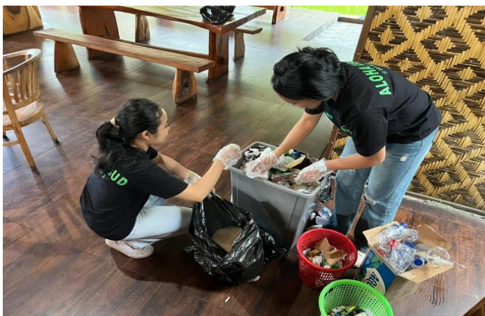
Gambar 3. Pemilahan Sampah (Organik, Anorganik, dan Residu)

Selain itu, dilakukan pula program pengoptimalan pemilahan sampah sebagai bagian dari upaya menciptakan lingkungan kerja yang bersih dan berkelanjutan. Kegiatan ini dilakukan melalui penyediaan tempat sampah terpisah sesuai jenisnya, yaitu organik, anorganik, dan residu, serta pemberian edukasi kepada karyawan mengenai pentingnya pengelolaan sampah. Pendampingan juga dilakukan secara langsung agar karyawan terbiasa dalam memilah sampah sesuai dengan kategorinya dalam aktivitas sehari-hari. Hasil dari kegiatan ini menunjukkan adanya peningkatan kesadaran dan kedisiplinan karyawan dalam menjaga kebersihan lingkungan. Lingkungan kerja menjadi lebih bersih, sehat, dan tertata, sehingga memberikan kenyamanan bagi wisatawan maupun karyawan. Selain itu, kegiatan ini juga mendukung penerapan konsep pariwisata berkelanjutan yang ramah lingkungan.