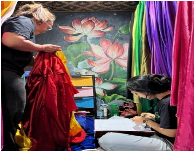
Gambar 2. Pemilahan dress di Aloha Ubud Swing

Selain itu, dilakukan pula program pengoptimalan pemilahan sampah sebagai bagian dari upaya menciptakan lingkungan kerja yang bersih dan berkelanjutan. Kegiatan ini dilakukan melalui penyediaan tempat sampah terpisah sesuai jenisnya, yaitu organik, anorganik, dan residu, serta pemberian edukasi kepada karyawan mengenai pentingnya pengelolaan sampah. Pendampingan juga dilakukan secara langsung agar karyawan terbiasa dalam memilah sampah sesuai dengan kategorinya dalam aktivitas sehari-hari. Hasil dari kegiatan ini menunjukkan adanya peningkatan kesadaran dan kedisiplinan karyawan dalam menjaga kebersihan lingkungan. Lingkungan kerja menjadi lebih bersih, sehat, dan tertata, sehingga memberikan kenyamanan bagi wisatawan maupun karyawan. Selain itu, kegiatan ini juga mendukung penerapan konsep pariwisata berkelanjutan yang ramah lingkungan.