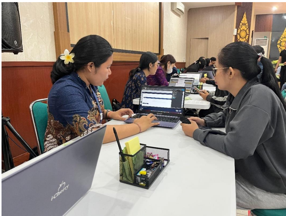
Gambar 1. Pendampingan aktivasi akun Coretax kepada wajib pajak