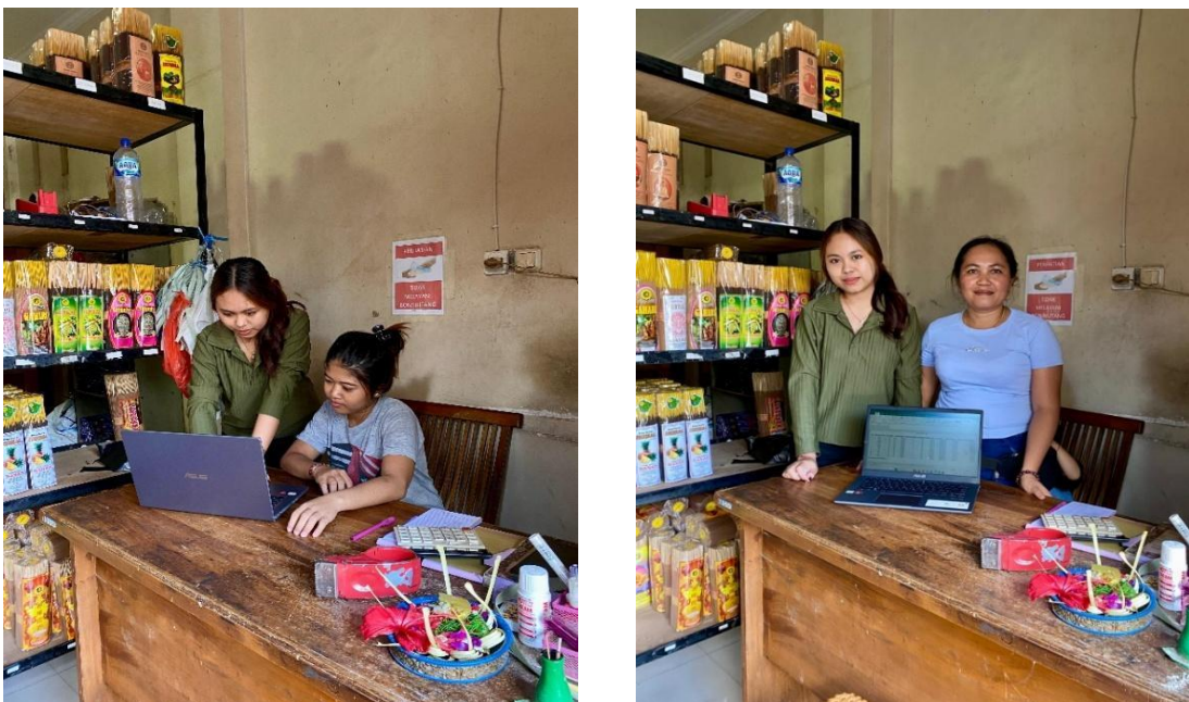
Gambar 2. Memberikan sosialisasi manfaat dan keunggulan sistem pencatatan gaji berbasis Microsoft excel serta implementasi program kerja ke pada mitra guna meminimalisir kesalahan perhitungan