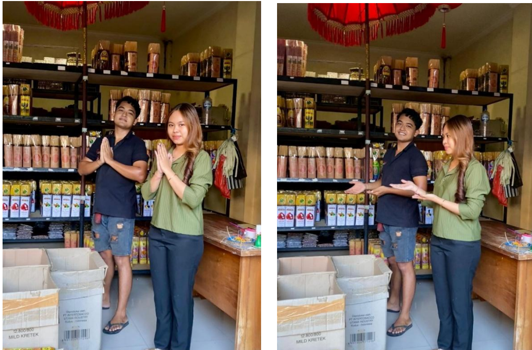
Gambar 3. Memberikan sosialisasi manfaat dan keunggulan pelatihan pelayanan menyapa pelanggan serta implementasi program kerja ke pada mitra guna meningkatkan loyalitas pelanggan