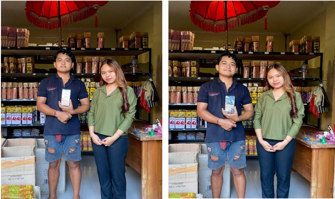
Gambar 1. Memberikan sosialisasi manfaat dan keunggulan sistem pemasaran berbasis digital seperti Shopee dan Instagram serta implementasi program kerja ke pada mitra guna meningkatkan penjualan