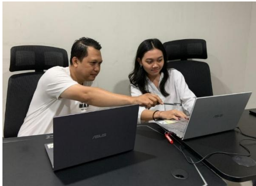
Gambar 1. Penyusunan Pedoman ( Guidline )