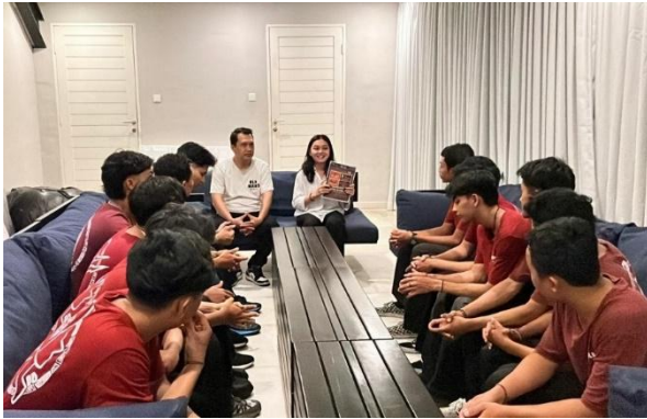
Gambar 2. Pelaksanaan Micro Training