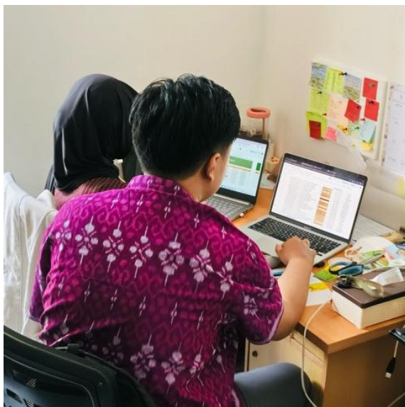
Gambar 5. Pelatihan Digitalisasi Sistem Pencatatan Pendapatan Harian Jasa Sertifikasi