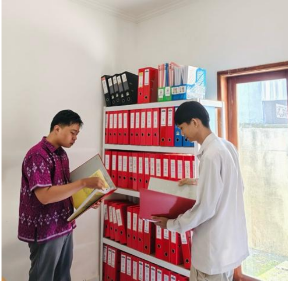
Gambar 9. Pengarahan Pengelolaan Arsip dan Rekap Dokumen Pendapatan Jasa Sertifikasi

Pelaksanaan pengelolaan arsip dan rekap dokumen pendapatan jasa sertifikasi melalui peninjauan kelengkapan, kerapian, kesesuaian arsip, serta ketepatan rekap pendapatan sebagai bahan perbaikan administrasi di periode berikutnya. Kegiatan ini juga mencakup penataan dokumen secara sistematis, pengelompokan arsip berdasarkan jenis layanan dan periode waktu, serta pengecekan kembali kesesuaian data antara dokumen fisik dengan data yang telah dicatat dalam sistem. Dengan pengelolaan arsip yang lebih teratur, diharapkan proses pencarian dokumen, verifikasi data, serta penyusunan laporan keuangan dapat dilakukan dengan lebih mudah, cepat, dan akurat.