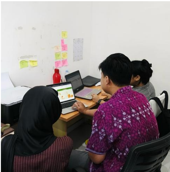
Gambar 8. Penyuluhan Penyajian Grafik Tren Pendapatan dan Frekuensi Layanan Sertifikasi

Memberikan pendampingan sederhana dalam mengolah data pendapatan jasa sertifikasi berdasarkan jenis layanan (seperti PBPHH, PBUI, TPT-KB, EKSPORTIR, IMPORTIR) untuk mengetahui tren layanan, jenis layanan yang paling banyak digunakan, serta sebagai dasar penyusunan strategi peningkatan layanan. Selain itu, kegiatan ini juga mencakup pengelompokan data berdasarkan kategori layanan, penyusunan tabel rekapitulasi, serta pemanfaatan fitur grafik sederhana pada Google Spreadsheet agar data lebih mudah dianalisis dan dipahami. Dengan pengolahan data tersebut, perusahaan dapat memperoleh gambaran yang lebih jelas mengenai perkembangan layanan serta mendukung pengambilan keputusan yang lebih tepat dalam meningkatkan kualitas dan efektivitas pelayanan.