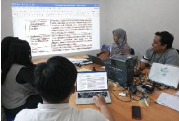
Gambar 11. Sosialisasi Penerapan Disiplin Pencatatan Pendapatan Jasa Sertifikasi

kemudian digunakan sebagai dasar untuk memberikan rekomendasi perbaikan, sehingga pengelolaan data pendapatan dapat dilakukan secara lebih tertib, akurat, dan efisien pada periode selanjutnya.