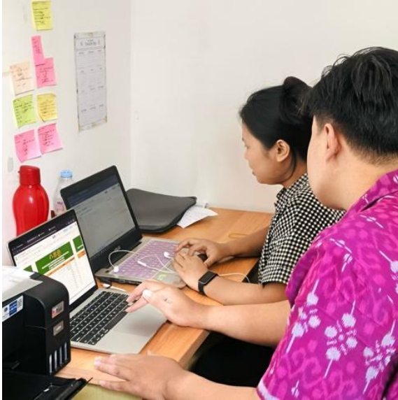
Gambar 6. Pendampingan Penyajian Rekapitulasi Pendapatan Jasa Sertifikasi Periode Bulanan

Membimbing penyusunan template Google Spreadsheet untuk rekapitulasi pendapatan jasa sertifikasi bulanan berdasarkan hasil pencatatan harian yang telah dilakukan, guna memudahkan pemantauan dan pelaporan pendapatan secara terstruktur. Selain itu, kegiatan ini juga meliputi pengaturan format tabel, penggunaan rumus otomatis untuk menjumlahkan data bulanan, serta penataan data agar lebih sistematis dan mudah dianalisis. Dengan adanya template ini, staf administrasi dapat melakukan rekapitulasi pendapatan secara lebih cepat, akurat, dan efisien, sehingga proses penyusunan laporan keuangan bulanan dapat dilakukan dengan lebih mudah dan terorganisir.