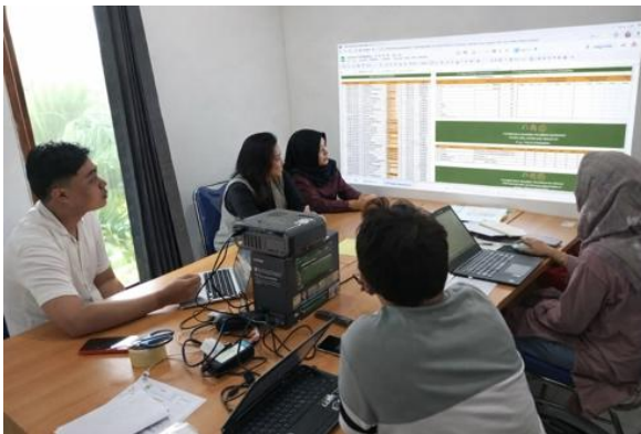
Gambar 10. Evaluasi Pengelolaan Data Pendapatan Jasa Sertifikasi

Pelaksanaan pengelolaan arsip dan rekap dokumen pendapatan jasa sertifikasi melalui peninjauan kelengkapan, kerapian, kesesuaian arsip, serta ketepatan rekap pendapatan sebagai bahan perbaikan administrasi di periode berikutnya. Kegiatan ini juga mencakup penataan dokumen secara sistematis, pengelompokan arsip berdasarkan jenis layanan dan periode waktu, serta pengecekan kembali kesesuaian data antara dokumen fisik dengan data yang telah dicatat dalam sistem. Dengan pengelolaan arsip yang lebih teratur, diharapkan proses pencarian dokumen, verifikasi data, serta penyusunan laporan keuangan dapat dilakukan dengan lebih mudah, cepat, dan akurat.