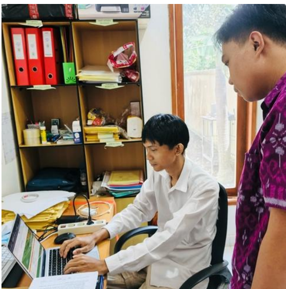
Gambar 7. Pelatihan Pengelompokan Pendapatan Berdasarkan Jenis Layanan Sertifikasi

Membimbing penyusunan template Google Spreadsheet untuk rekapitulasi pendapatan jasa sertifikasi bulanan berdasarkan hasil pencatatan harian yang telah dilakukan, guna memudahkan pemantauan dan pelaporan pendapatan secara terstruktur. Selain itu, kegiatan ini juga meliputi pengaturan format tabel, penggunaan rumus otomatis untuk menjumlahkan data bulanan, serta penataan data agar lebih sistematis dan mudah dianalisis. Dengan adanya template ini, staf administrasi dapat melakukan rekapitulasi pendapatan secara lebih cepat, akurat, dan efisien, sehingga proses penyusunan laporan keuangan bulanan dapat dilakukan dengan lebih mudah dan terorganisir.