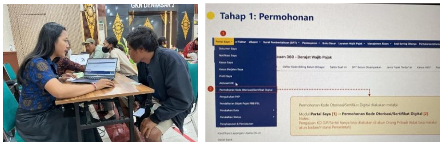
Gambar 5. Pembuatan Kode Otorisasi Direktorat Jenderal Pajak (KODJP)

Sebagai alat verifikasi keamanan tanda tangan elektronik yang wajib dilakukan untuk melaporkan SPT Tahunan 2025. KODJP ini dapat memastikan validitas transaksi, meningkatkan keamanan data, dan modernisasi administrasi guna mendukung transformasi digital perpajakan Indonesia dalam pelaporan. Kode otorisasi juga disebut proses pemberian persetujuan digital oleh wajib pajak untuk menandatangani dokumen perpajakan secara elektronik. Pembuatan KODJP atau sertifikat elektronik sering dilakukan dalam satu proses yang sama dengan pengaturan passphrase . Passphrase adalah bagian dari KODJP, tanpa passphrase yang benar KODJP tidak dapat digunakan.