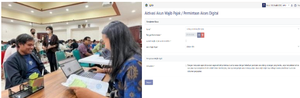
Gambar 2. Membantu Aktivasi Akun Wajib Pajak

Aktivasi akun wajib pajak dilaksanakan untuk melakukan pendaftaran ke dalam sistem Coretax dan pengaktifan agar dapat mengakses fitur Coretax secara penuh dan pengaktifan status NPWP yang digunakan untuk Pelaporan SPT Tahunan Wajib Pajak. Dalam pelayanan aktivasi akun yang dilakukan penulis untuk membantu wajib pajak yang sudah memiliki akun DJP serta data kontak yang sudah valid tanpa ada perubahan. Aktivasi akun wajib pajak yang melakukan perubahan data dan mengaktifkan dan menonaktifkan NPWP akan dilayani langsung oleh karyawan KPP. Setelah dilaksanakan aktivasi akun baru dapat dilaksanakan pelaporan SPT Tahunan wajib pajak yang dapat dilaksanakan secara online melalui sistem Coretax.