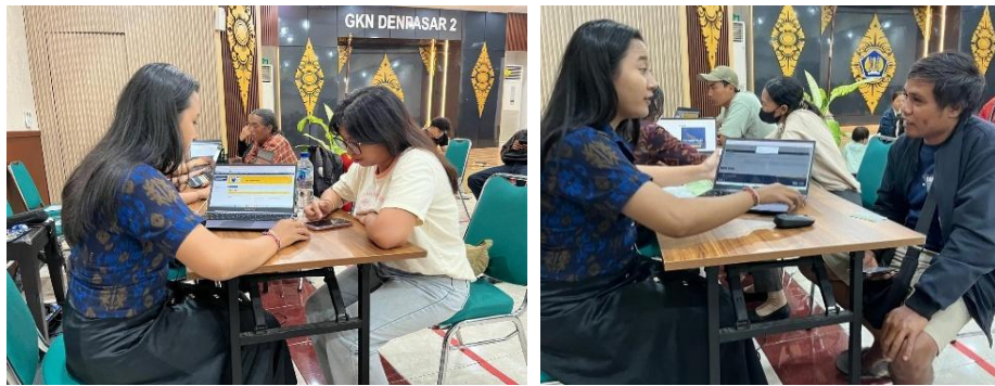
Gambar 4. Mendukung wajib pajak terkait tata cara pelaporan SPT Tahunan