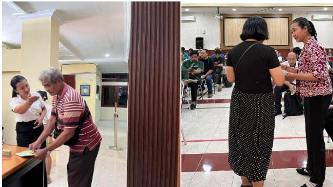
Gambar 1. Pengarah Layanan dalam Proses Pelaporan SPT Tahunan

akan diberikan menuju aktivasi akun apabila wajib pajak belum melakukan aktivasi pada sistem terbaru yaitu Coretax.