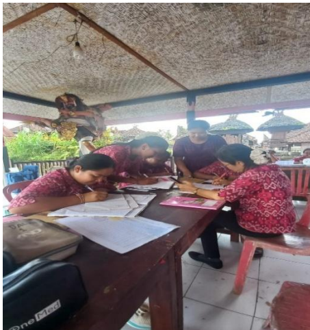
Gambar 3. Pengumpulan data manual, sebelum pelatihan sistem