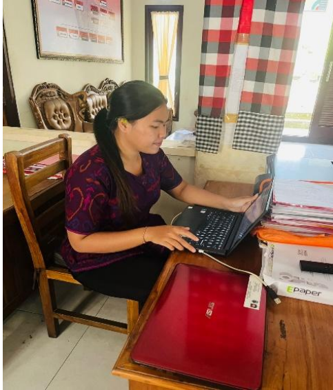
Gambar 1. Verifikasi dan Pembaruan Data Penduduk