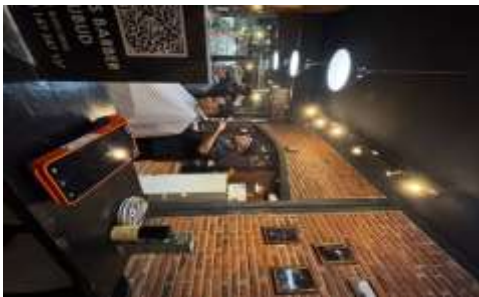
Gambar 1. Lokasi Bliss barbershop Ubud

adalah tertundanya pengambilan keputusan strategis. Gitman dan Zutter (2015) menegaskan bahwa laporan keuangan adalah alat navigasi utama bagi manajer untuk menentukan arah masa depan perusahaan. Tanpa adanya data keuangan yang valid, pemilik Bliss Barbershop tidak memiliki dasar yang kuat untuk memutuskan kapan harus melakukan ekspansi, menambah kursi layanan, atau melakukan renovasi interior. Keputusan yang diambil hanya berdasarkan intuisi atau perkiraan semata seringkali membawa risiko kegagalan yang tinggi. Selain itu, ketiadaan laporan keuangan yang terstandarisasi menjadi hambatan besar bagi Bliss Barbershop untuk mengakses modal kerja dari sektor perbankan. Lembaga keuangan formal mensyaratkan adanya laporan keuangan sebagai bukti kredibilitas dan kemampuan membayar (bankability) bagi UMKM yang mengajukan kredit (Sitorus & Sitorus, 2018).