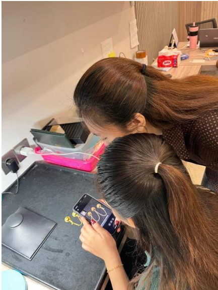
Gambar 7. Pelatihan dan pendampingan optimalisasi Instagram sebagai media promosi.

berhasil karena seluruh kegiatan yang direncanakan dapat terlaksana dengan baik serta mampu memberikan manfaat bagi mitra. Penerapan pencatatan kas kecil berbasis Microsoft Excel membantu dalam meningkatkan kerapian dan ketepatan pencatatan keuangan, sedangkan optimalisasi media sosial Instagram mampu meningkatkan efektivitas promosi digital.