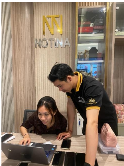
Gambar 3. Penyusunan dan penyesuaian format pencatatan kas kecil berbasis Microsoft Excel .

Berdasarkan tabel di atas, dapat disimpulkan bahwa seluruh program kerja yang telah direncanakan dapat terealisasi dengan baik dengan tingkat pencapaian sebesar 100%. Adapun ketercapaian kegiatan yang telah dilakukan antara lain sebagai berikut: