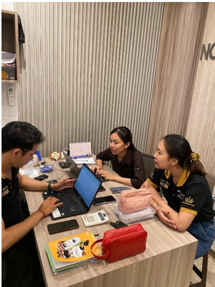
Gambar 2. Observasi dan koordinasi dengan mitra terkait kebutuhan dan pelaksanaan program kerja.

Pelaksanaan program kerja pada Toko Emas Notina Klungkung dilaksanakan berdasarkan hasil analisis situasi yang telah dilakukan sebelumnya. Program kerja yang dijalankan berfokus pada peningkatan kapasitas digital mitra melalui penerapan pencatatan kas kecil berbasis Microsoft Excel serta optimalisasi media sosial Instagram sebagai sarana promosi. Secara umum, kegiatan yang telah dilaksanakan dapat berjalan dengan baik dan memberikan dampak positif terhadap pengelolaan usaha mitra.