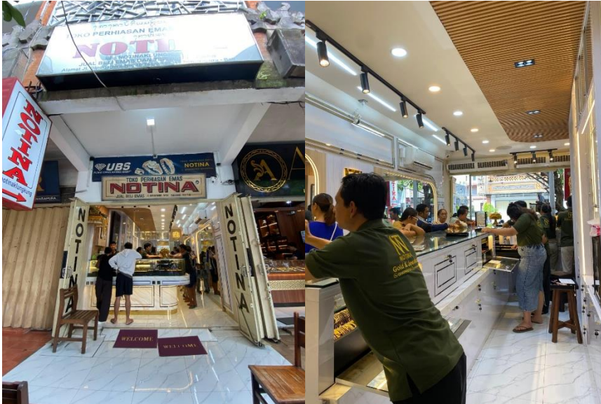
Gambar 1. Situasi Toko Emas Notina Klungkung.