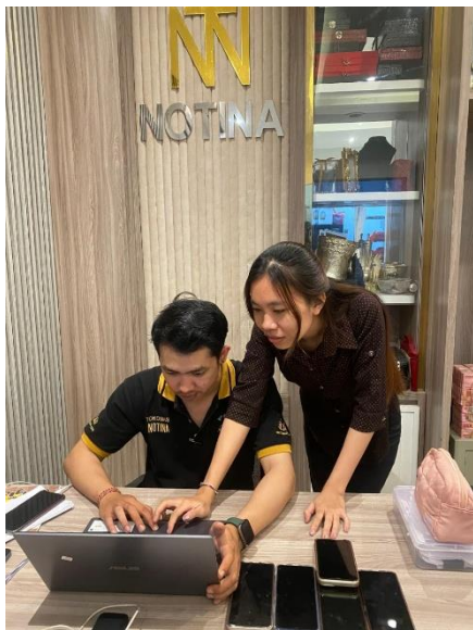
Gambar 4. Pelatihan dan pendampingan penggunaan Microsoft Excel dalam pencatatan kas kecil.

Selanjutnya, dalam pelaksanaan kegiatan ini terdapat beberapa faktor yang mendukung dan menghambat jalannya program kerja, yaitu sebagai berikut: