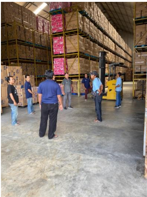
Gambar 2. Sosialisasi dan Edukasi kepada Karyawan