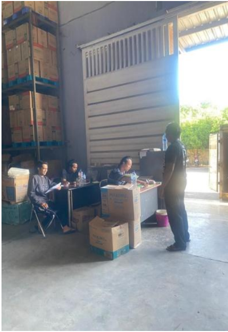
Gambar 1. Observasi, Identifikasi Masalah, dan Merancang Program Kerja