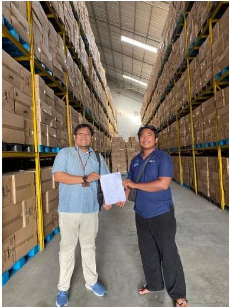
Gambar 5. Monitoring oleh Dosen Pembimbing