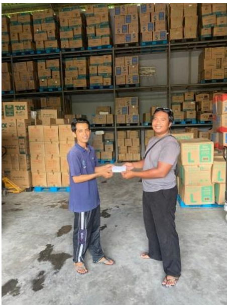
Gambar 4. Memberikan reward kepada karyawan