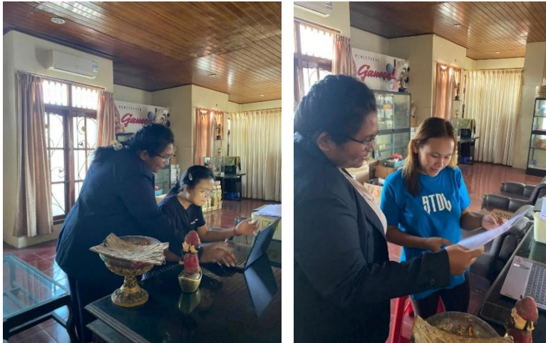
Gambar 2. Melakukan diskusi dan pelatihan kepada karyawan terkait pengelolaan waktu dalam proses produksi dan pengiriman sesuai dengan penerapan sistem digital dan SOP yang telah disusun agar alur kerja lebih terstruktur dan pengiriman dapat dilakukan tepat waktu.