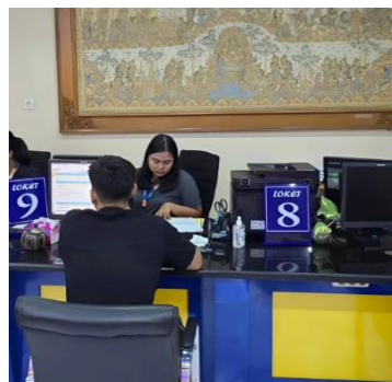
Gambar 4. Konsultasi mengenai pertanyaan atau masalah yang dihadapi wajib pajak