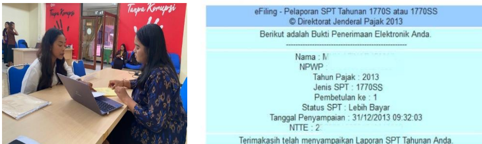
Gambar 3. Pendampingan wajib pajak terkait dengan kesalahan pelaporan SPT