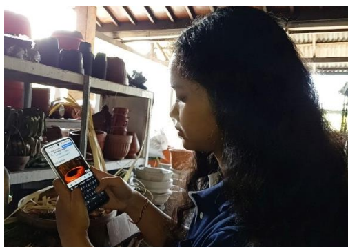
Gambar 3. Pembuatan dan Pengelolaan Akun Media Sosial