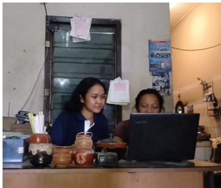
Gambar 1. Penerapan Sistem Pembukuan Digital

Dokumentasi Hasil Program Kerja Pengabdian Masyarakat: