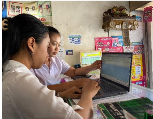
Gambar 1. Pemberian Pelatihan Aplikasi Excel untuk Mitra Kerja

Program tambahan berupa pendampingan penggunaan Google Drive juga memberikan manfaat nyata. Seluruh data pencatatan keuangan dan stok kini tersimpan secara aman melalui sistem cloud , sehingga risiko kehilangan data akibat kerusakan perangkat atau hilangnya catatan manual dapat diminimalisir. Melalui penyimpanan berbasis cloud , mitra dapat mengakses data secara real-time dari berbagai perangkat, baik komputer, laptop, maupun ponsel. Fleksibilitas ini memudahkan pemantauan usaha serta mendukung pengambilan keputusan yang lebih cepat dan tepat.