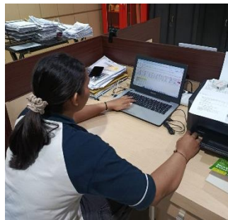
Gambar 1 Proses Observasi

Kegiatan diawali dengan observasi lapangan untuk mengidentifikasi permasalahan utama yang dihadapi perusahaan dalam hal pelaporan pekerjaan dan pencatatan keuangan.