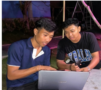
Gambar 1. Dokumentasi Kegiatan