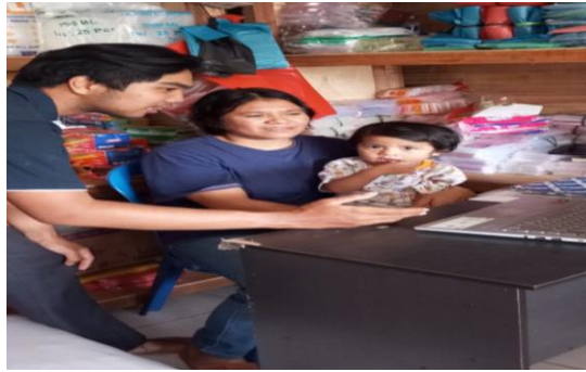
Gambar 1. Pengenalan dan Wawancara pada Mitra

TOKO ANDRA PLASTIK dapat menggunakan excel dalam pencatan arus kas Perusahaan. Untuk memberikan laporan yang detail serta efisien dan akurat pada Perusahaan TOKO ANDRA PLASTIK