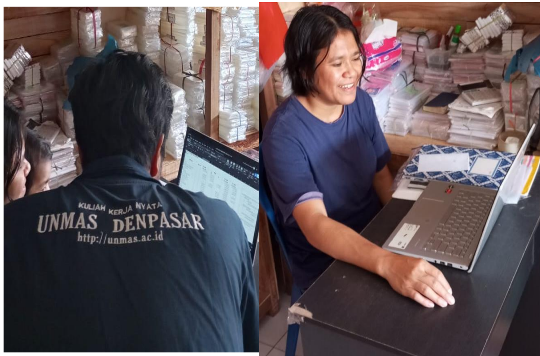
Gambar 2. Membantu Mitra dalam membuat laporan keuangan di Excel

TOKO ANDRA PLASTIK dapat menggunakan excel dalam pencatan arus kas Perusahaan. Untuk memberikan laporan yang detail serta efisien dan akurat pada Perusahaan TOKO ANDRA PLASTIK