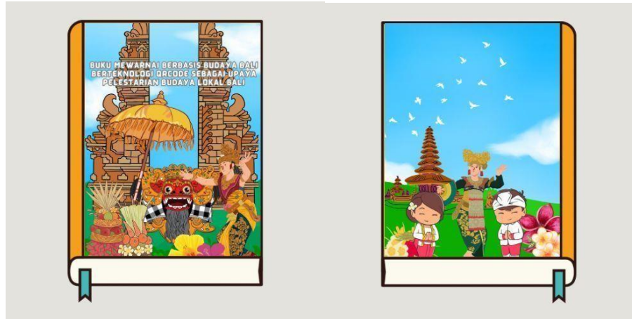
Gambar 1. Bagian sampul buku yang di desain menggunakan gambar keanekaragaman budaya lokal Bali dengan warna menarik yang bertujuan untuk menarik minat generasi muda khususnya anak-anak dalam memiliki buku ini.