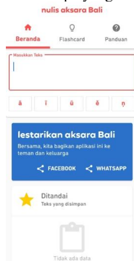
Gambar 3. Layar utama Nulis aksara bali.