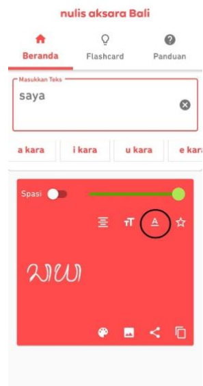
Gambar 6. Opsi mengubah jenis tulisan aksara bali.