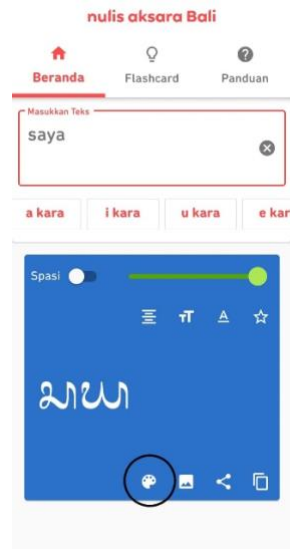
Gambar 8. Opsi mengubah warna latar belakang.