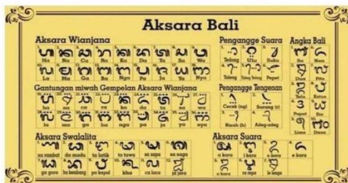
Gambar 1. Jenis-jenis aksara Bali.

Aksara Modre adalah aksara Bali yang sulit dibaca karena terdapat pengangge aksara. Selain itu, aksara Modre juga dilambangkan dengan gambar-gambar tertentu. Sebagai informasi, aksara Modre terbagi menjadi empat jenis yakni tipe utama, tipe aksara kotak, tipe lambang-lambang, dan tipe lain-lain.