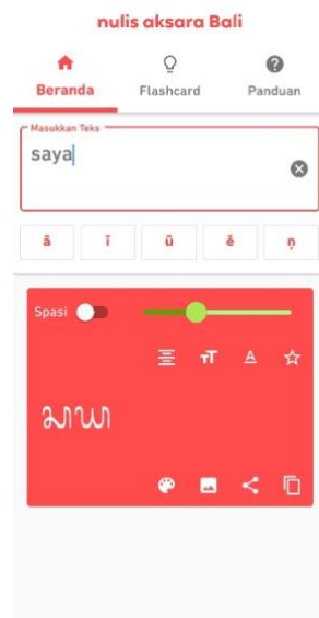
Gambar 4. Hasil terjemahannya.