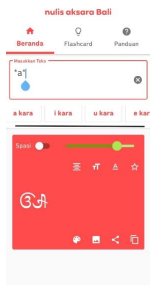
Gambar 7. Beragam jenis aksara bali di bawah kotak “Masukkan Teks”.