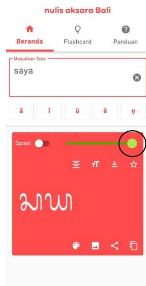
Gambar 5. Opsi untuk mengubah ukuran tulisan.